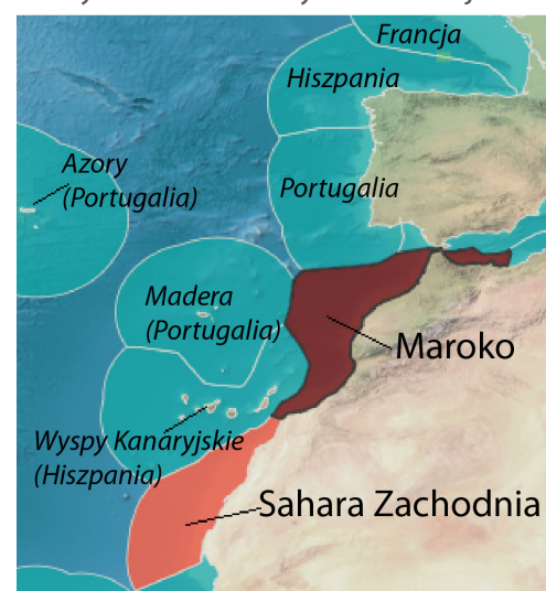
Wody Maroka i Sahary Zachodniej

Źródło danych: dane zaczerpnięte w dniu 28 stycznia 2019 r. z MarineRegions.org . Inne wyłączone strefy ekonomiczne państw przybrzeżnych zaznaczono kolorem zielononiebieskim.