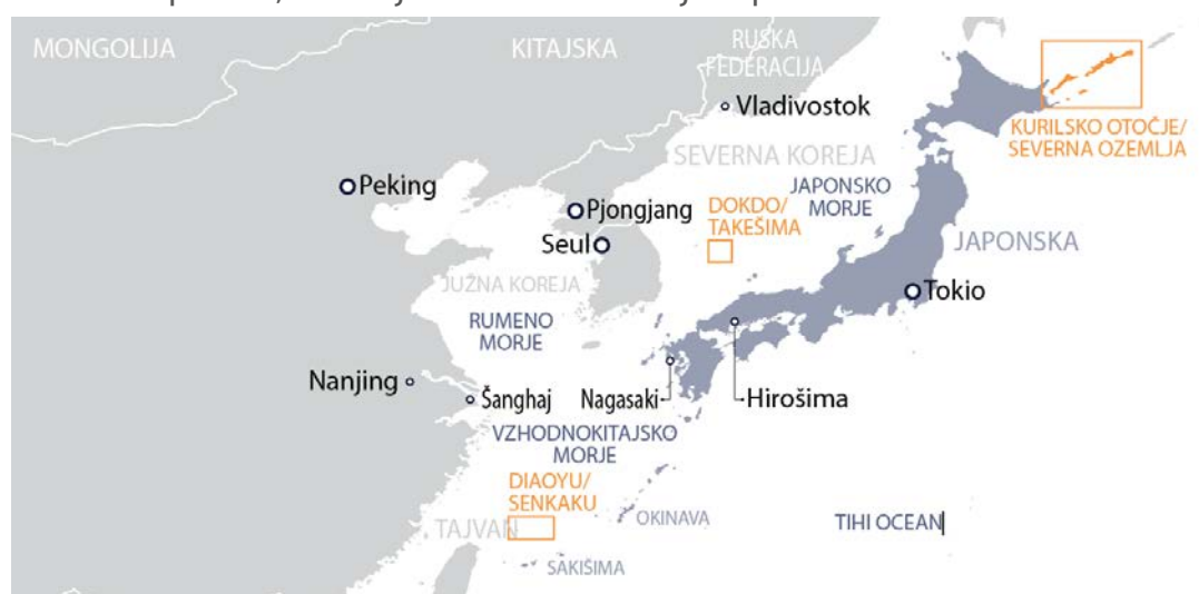
Slika 1 – Japonska, sosednje države in ozemeljski spori

Evropska unija in Japonska, na področju varnosti obe odvisni od Združenih držav Amerike, se osredotočata na različne geopolitične dejavnike. Evropska unija je zaskrbljena zaradi vprašanj, kot sta boj proti terorizmu in reševanje migracijske krize. Zaradi ruske priključitve Krima in konflikta v vzhodni Ukrajini je prišlo do zastoja v dvostranskem dialogu z Rusijo in sprejetja sankcij, poleg tega pa ti dve vprašanji povzročata skrbi tudi v baltskih državah. Evropska unija si prizadeva za sodelovanje s Kitajsko, odnosi z ameriškim predsednikom Donaldom Trumpom pa so bolj zapleteni. Japonska sodeluje z Rusijo, da bi s pogajanjem dosegla rešitev za vprašanje severnih ozemelj oz. južnih Kurilskih otokov, ki ostaja nerešeno že od konca druge svetovne vojne. Odnosi med Kitajsko in Južno Korejo so zaostreni tudi zaradi ozemeljskih sporov in zgodovinske zapuščine – Kitajska je s svojimi pomorskimi načrti in ozemeljskimi zahtevami na območju Vzhodnokitajskega in Južnokitajskega morja ter z vse večjo jedrsko in konvencionalno energijo precejšnja grožnja za Japonsko. Poleg tega pa je Kitajska zaradi severnokorejske krize in vztrajnih groženj Severne Koreje, uperjenih proti Japonski, okrepila svojo zmogljivost odzivanja. Predsednik japonske vlade Šinzo Abe medtem skuša