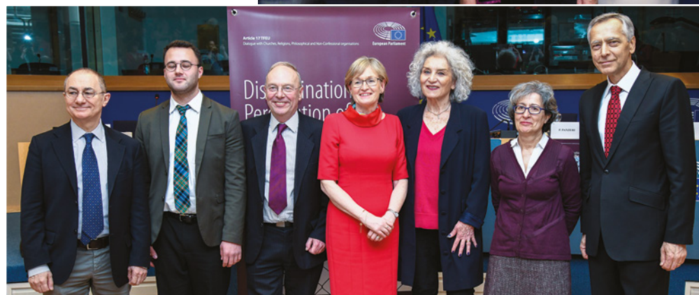
Séminaire de dialogue au titre de l'article 17 avec les responsables religieux "L'avenir de l'Europe" 27 juin 2017