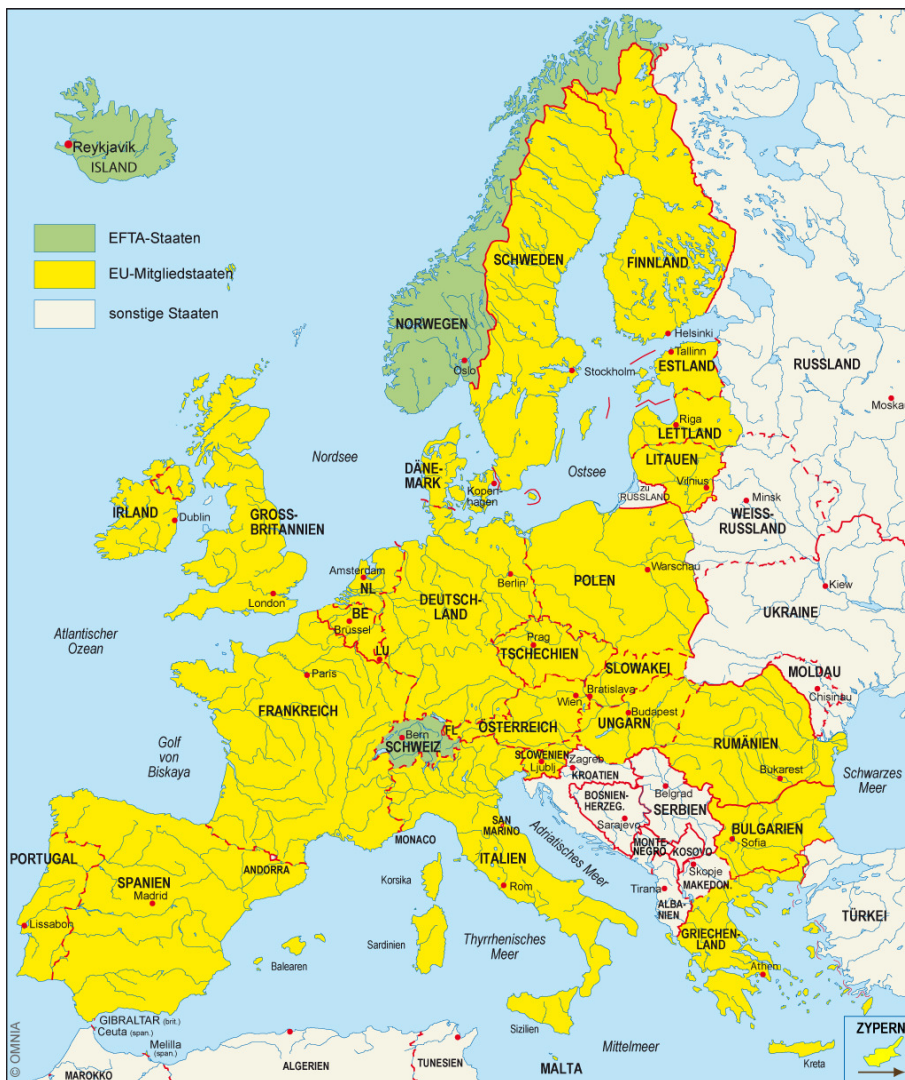
Die Staaten Europas