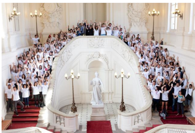
McCollins – Rassemblement des volontaires 19/06/2015 Marseille 1

Depuis sa création, près de 130 000 volontaires ont effectué une mission d'intérêt général, démontrant la valeur de l'engagement pour toute la jeunesse de France.