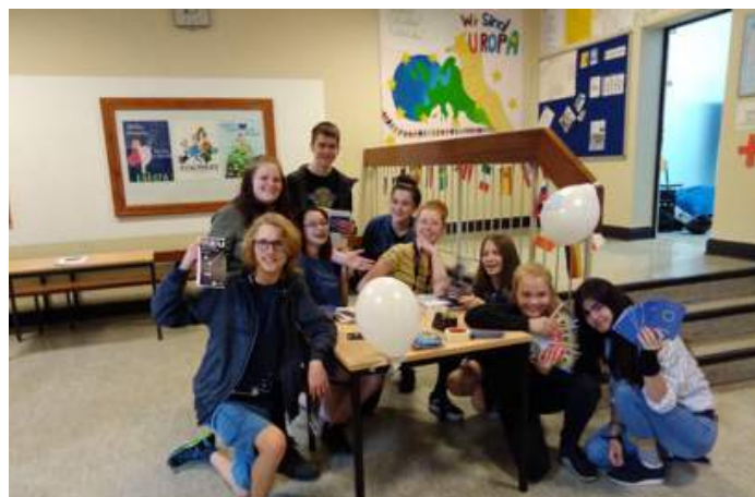
Die Europa AG vom Alten Gymnasium Bremen vor ihrem Infopoint

Die Europa-AG des Alten Gymnasiums Bremen plant derzeit einen Austausch mit den Juniorbotschafter/innen des Revius Lyceum Doorn, einer Botschafterschule aus den Niederlanden. Zustande kam der Kontakt über das Lehrerseminar Brüssel.