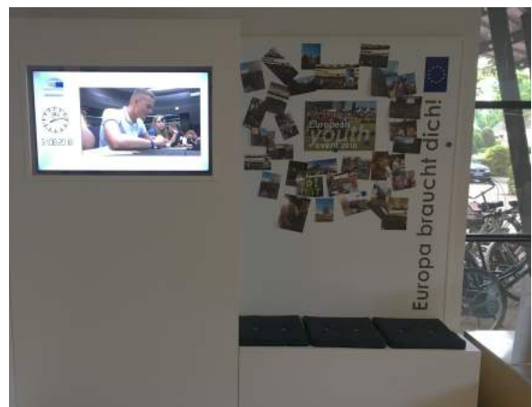
Europa-Café (Duisburg) und selbst gebaute Infopoint der BBS Friesoythe mit Bildschirm und Magnetwand