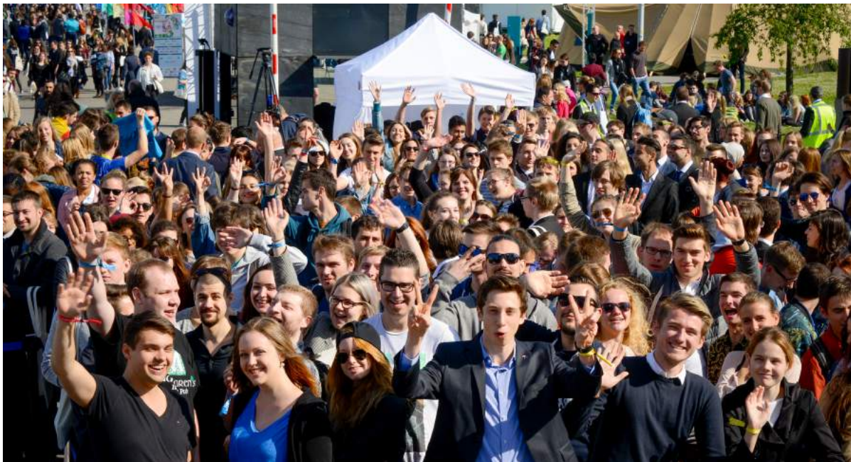
Jugendliche beim EYE in Straßburg

Vom 1.-2. Juni fand in Straßburg das European Youth Event (EYE2018) statt. Bei der Veranstaltung hatten junge Menschen die Gelegenheit, ihre Ideen und Vorstellungen im Rahmen von unterschiedlichen Workshops mit europäischen Entscheidungsträgern zu diskutieren. Insgesamt nahmen 8970 Jugendliche aus allen 28 Mitgliedstaaten und Ländern außerhalb der EU teil. Unter den Teilnehmenden waren auch einige Botschafterschulen aus Deutschland: Bad Bramsted, Recklinghausen, Essen, Seeheim-Jugenheim, Gladenbach, Ahaus, Westerburg, Friesoythe, Hamburg, Bad Bergzabern, Krefeld.