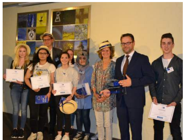
Verleihung der Plakette in Magdeburg (links) und Bremen (rechts)