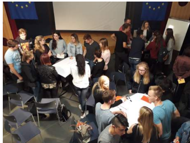
Podiumsdiskussion am Stiftgymnasium Xanten, Workshop am Berufskolleg am Wasserturm, Bocholt

Am 29. Juni fand in der Europa-Gesamtschule Brühl der Projekttag mit dem Thema „What does Europe mean to you?“ statt. Das Projekt wurde von den Schüler/innen des Projektkurses „Politik und Europa“ entwickelt und mit dem gesamten 10. Jahrgang durchgeführt. In verschiedenen Gruppen formulierten die Schüler/innen ihre Gedanken und Fragen zur EU. Nach der Pause simulierten sie in dem Planspiel Europäischer Konvent 2.0 Verhandlungen zwischen EU-Kommission, dem Europäischen Parlament und Ministerrat zu den Themen „Hauptstadt der EU“ und „EU-weites WLAN“ ( https://bit.ly/2x1l5ke ).