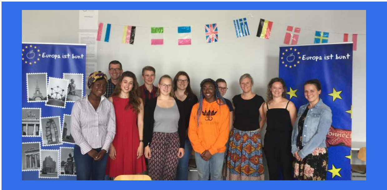
Titelbild: Schulbesuch am Korbinian-Aigner-Gymnasium Erding; am Rand die Aufsteller für das EU-Quiz

Liebe Junior- und Seniorbotschafter/innen,