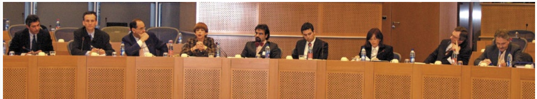
Lancement officiel du Programme d'Echanges le 19 mars 2007 au Parlement européen, à Bruxelles