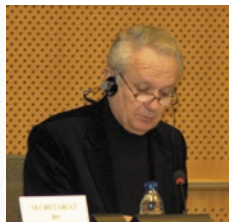
Jean-Marie Cavada, Président de la commission LIBE

Le lancement officiel de l'édition 2007 du Programme d'Echanges des Autorités Judiciaires s'est déroulé les 19-20 mars derniers au Parlement européen. Ainsi qu'il a été rapporté dans le dernier numéro de « La lettre du REFJ » (mars 2007), la cérémonie de lancement a eu lieu le 19 mars en présence