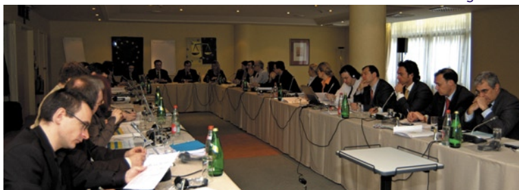
La réunion technique du groupe de suivi à Bruxelles

Parallèlement à ces activités, le REFJ a poursuivi l'étude de faisabilité initiée en 2005 afin d'identifier les obstacles à une participation active aux échanges et les moyens de développer encore dans le futur les possibilités offertes par le Programme d'Echanges.