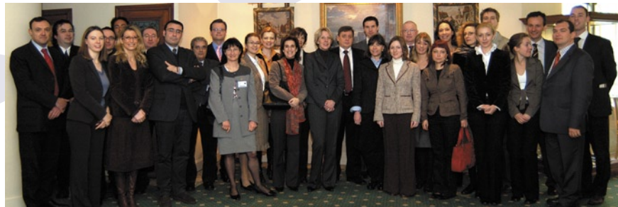
Réunion des points de contact du Programme d'Echanges, les 20 et 21 mars 2007 à Bruxelles

*Sauf pour les échanges de magistrats de Cours Suprêmes ainsi que ceux des Conseils Supérieurs de Justice pour lesquels un dispositif spécifique s'applique en partenariat avec les réseaux correspondants.