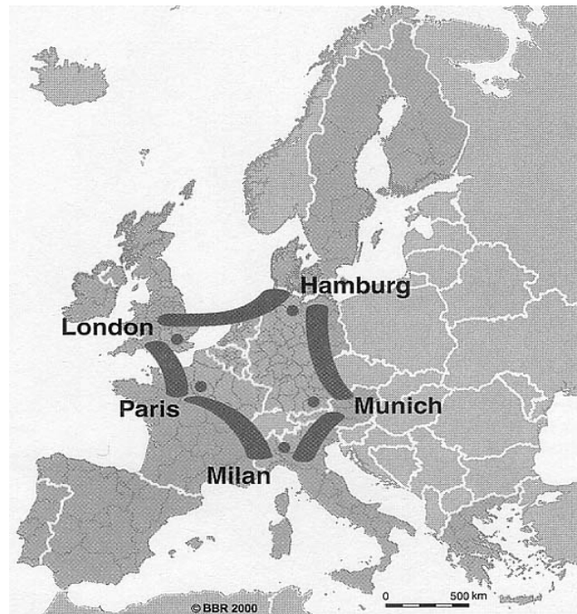
Europa – den blå bananen