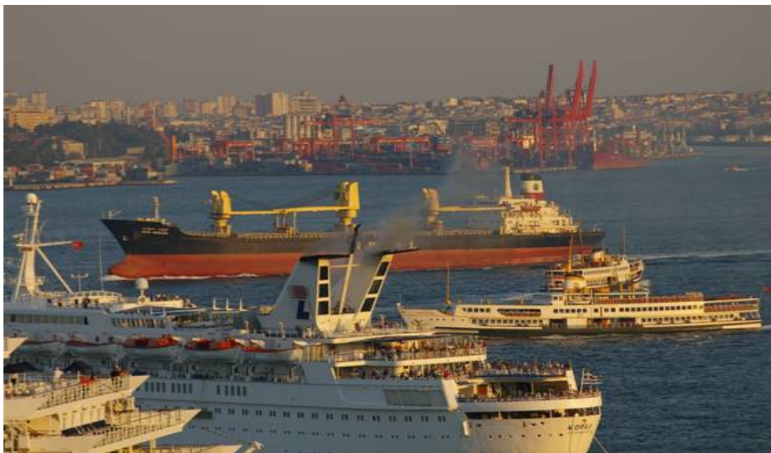
Bild 1: Ett av de granskade projekten bidrog till det övergripande målet att förbättra Turkiets sjösäkerhet och att förebygga förorening av haven i enlighet med EU-kraven.

VIII. Mot bakgrund av dessa iakttagelser rekommenderar revisionsrätten att kommissionen tar itu med de resterande bristerna i den övergripande planeringen och styrningen av verksamheten (se punkterna 65–71).