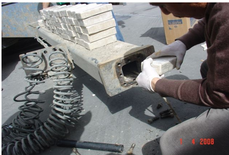
Bild 3: Misstänkt innehåll som upptäckts med hjälp av de EU-finansierade skannrarna.