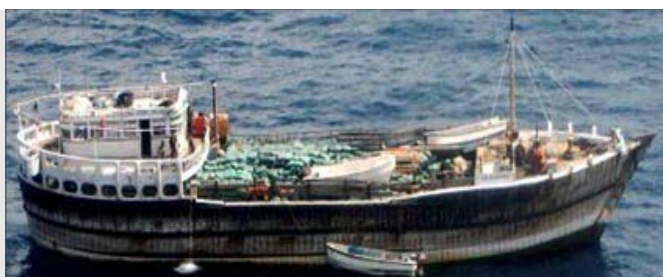
Bateau-mère pirate (boutre traditionnel transportant des skiffs d'attaque)