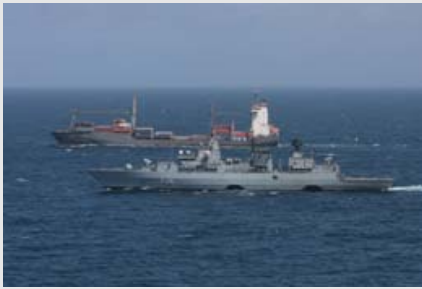
Escorte assurée par un navire de guerre de l'EU NAVFOR