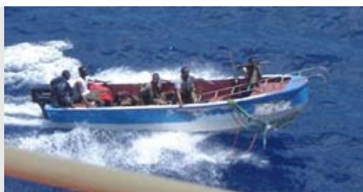
Skiff d'attaque pirate