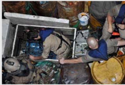
Assistance aux navires vulnérables