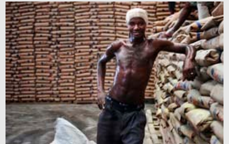
Le PAM à Mogadiscio

Grâce à son étroite coopération avec des gouvernements de la région tels que ceux du Kenya et de la République des Seychelles, l'EU NAVFOR a pu transférer aux autorités compétentes des personnes capturées pour actes de piraterie afin qu'elles soient poursuivies et jugées.