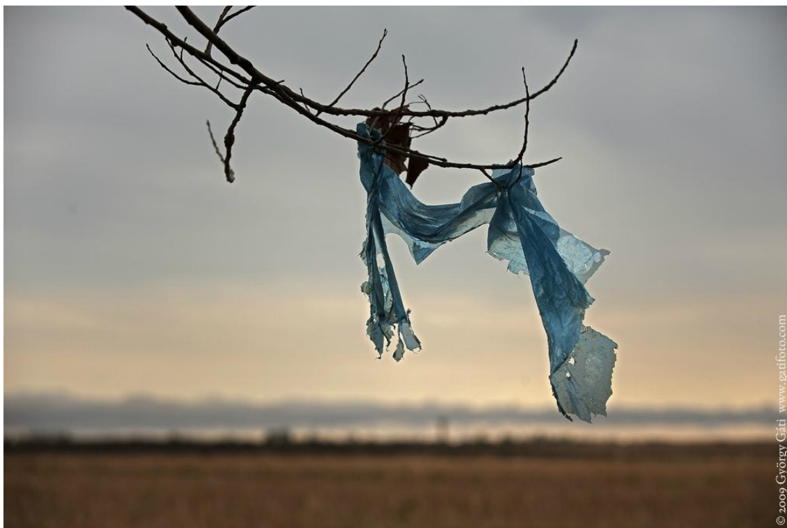
A kép fotópályázatunk tavalyi kiírásának egyik fordulójára érkezett