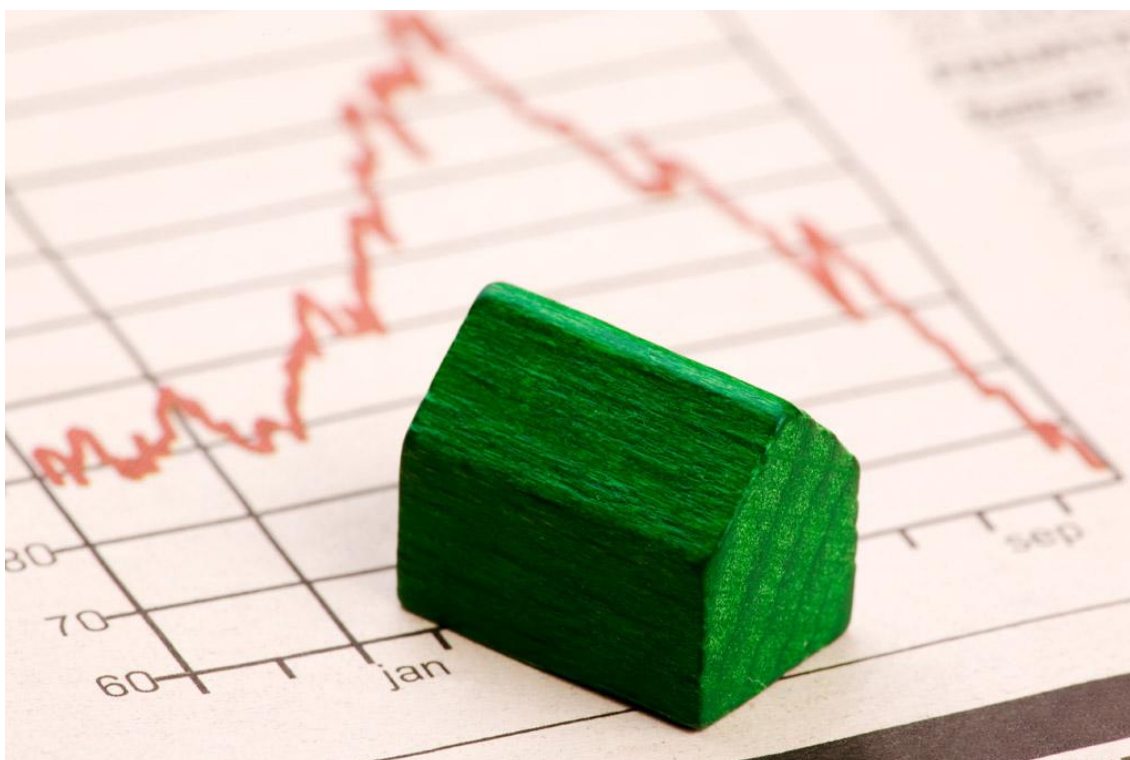
Símbolo de una casa y su hipoteca