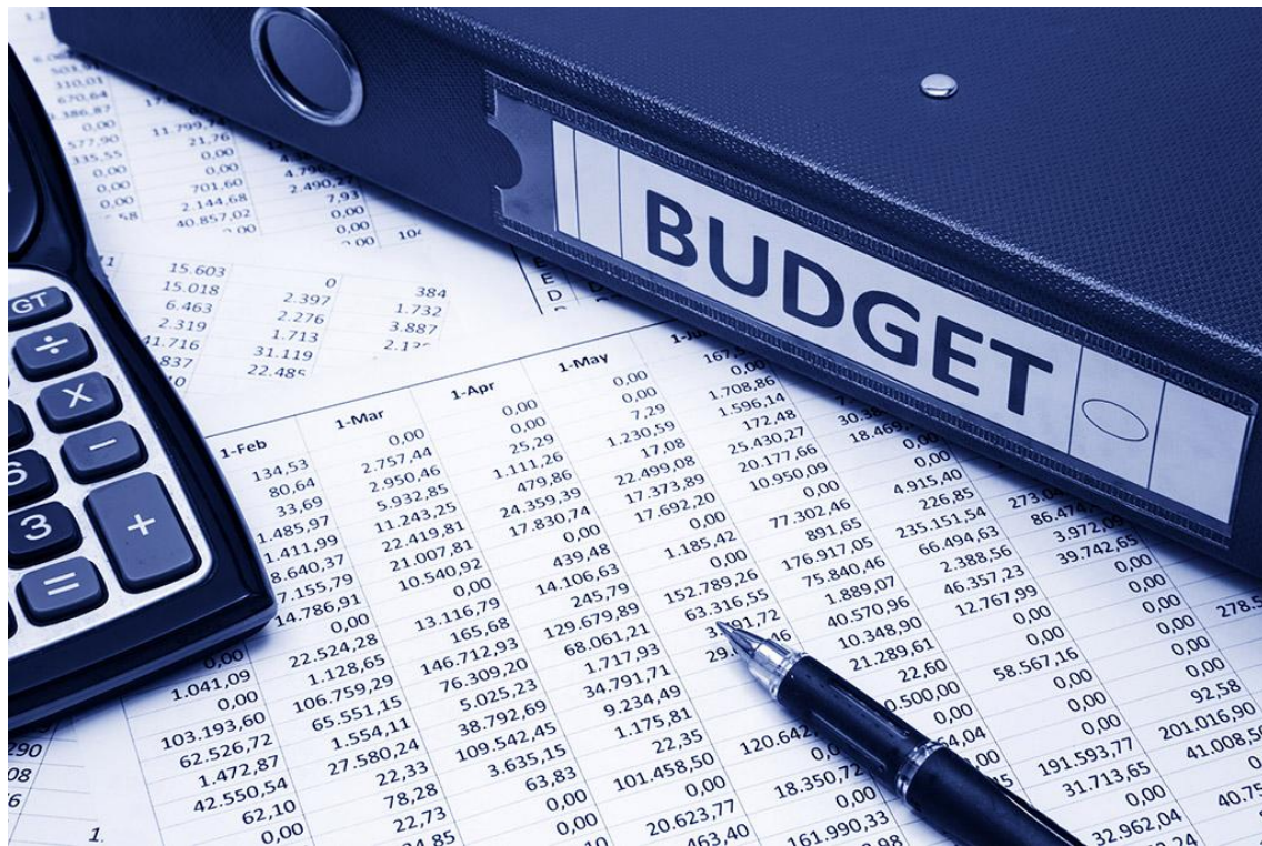
Budget illustration photo ©AP Images/ European Union-EP