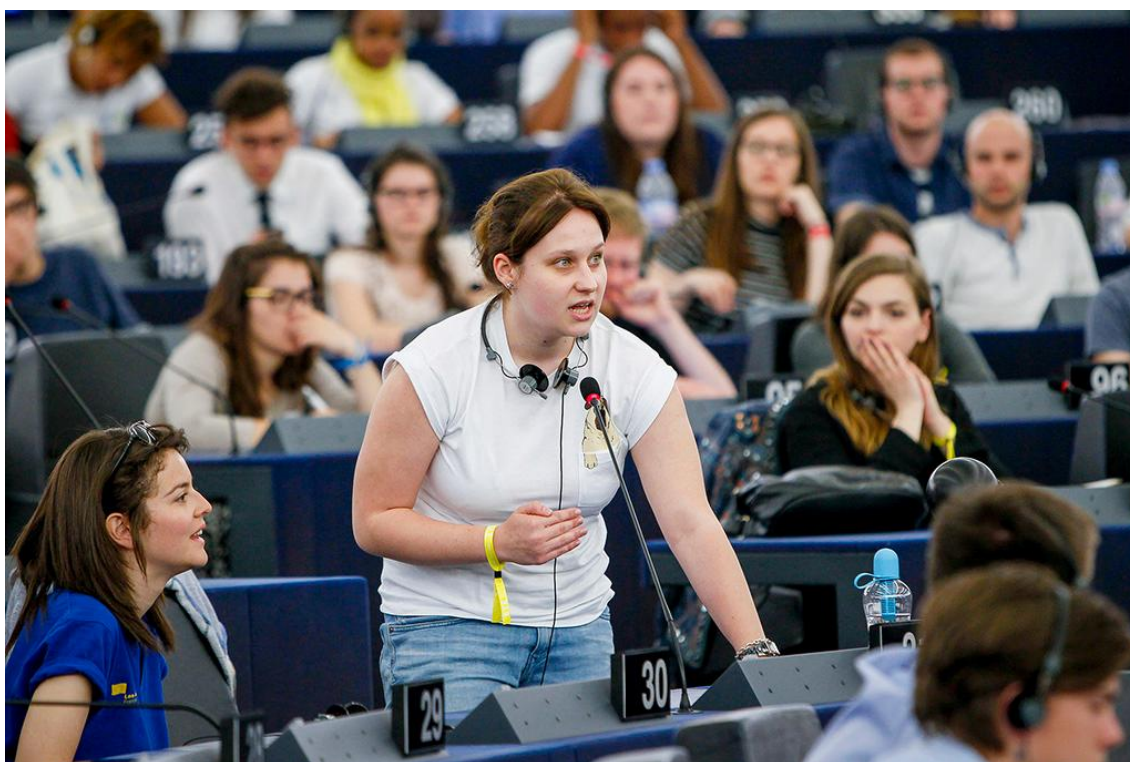
Noorteüritus tänavu mais parlamendi istungitesaalis Strasbourgis