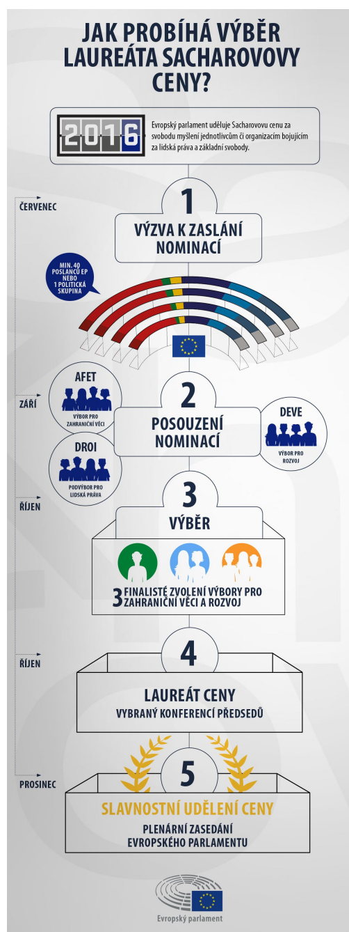
Infografický průvodce procesem výběru laureáta Sacharovy ceny