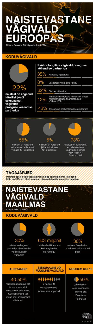
Naistevastane vägivald Euroopas