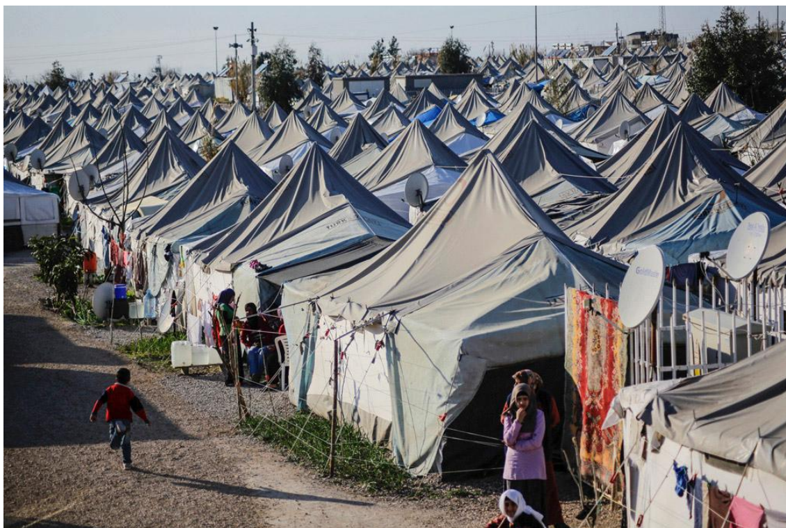
Ο προσφυγικός καταυλισμός στο Οσμανίγε. φιλοξενεί 9.486 πρόσφυγες