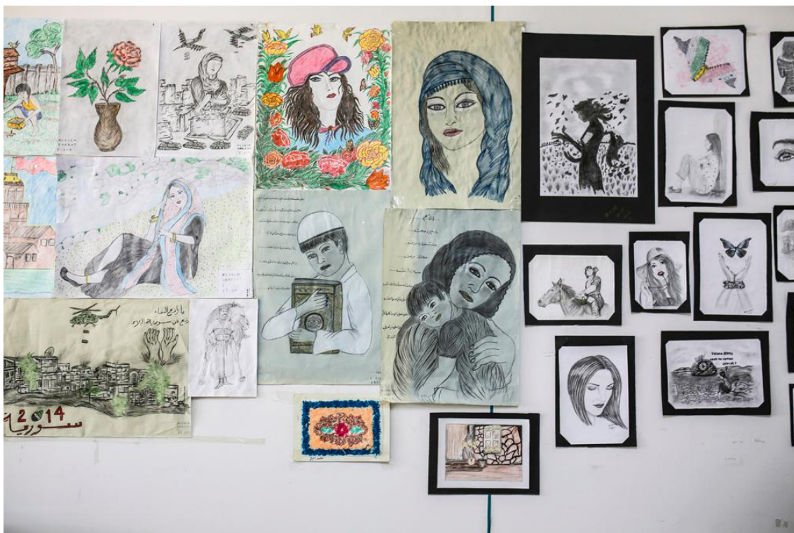
Ζωγραφιές προσφύγων στον καταλισμό Νιζίπ