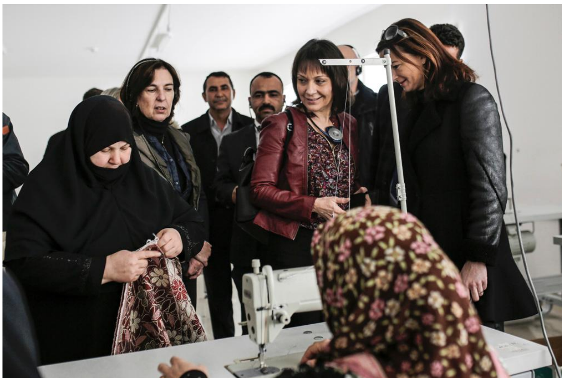
Η αντιπρόεδρος του ΕΚ Σιλβί Γκιγιόμ, συναντά Σύρια πρόσφυγα στον καταυλισμό του Νιζίπ