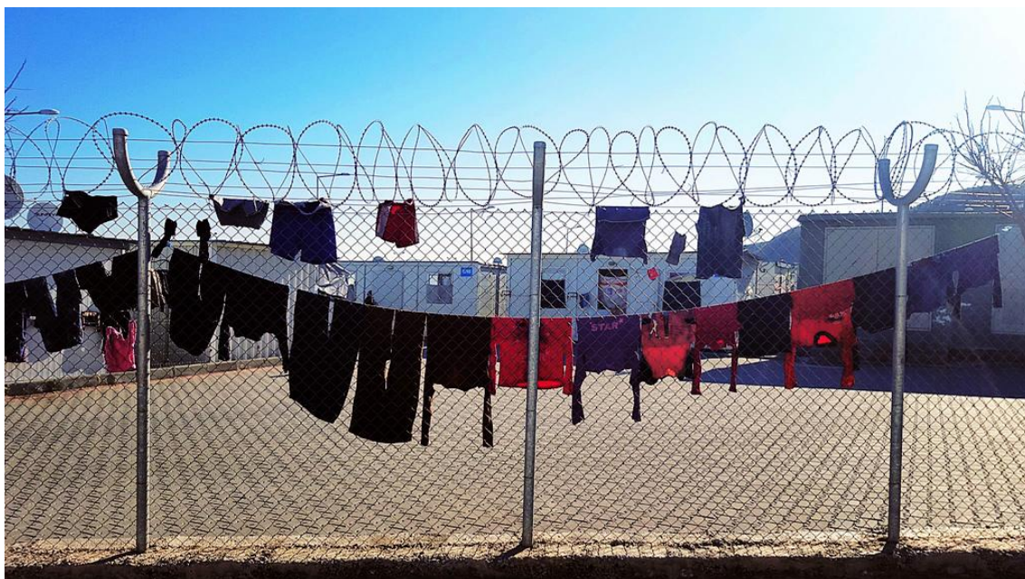
Παιδικά ρούχα που κρέμονται σε φράχτη για να στεγνώσουν, στον καταυλισμό Νιζίπ της Τουρκίας