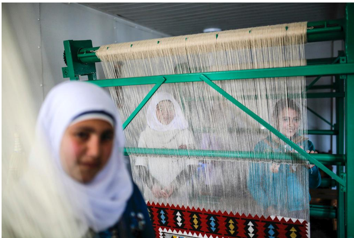
Νέα γυναίκα από τη Συρία, εργάζεται στον καταυλισμό Osmaniye