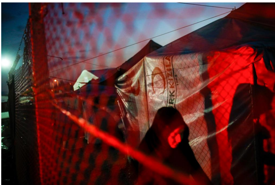
Η νύχτα πέφτει στον καταυλισμό Osmaniye κοντά στα σύνορα της Τουρκίας με τη Συρία