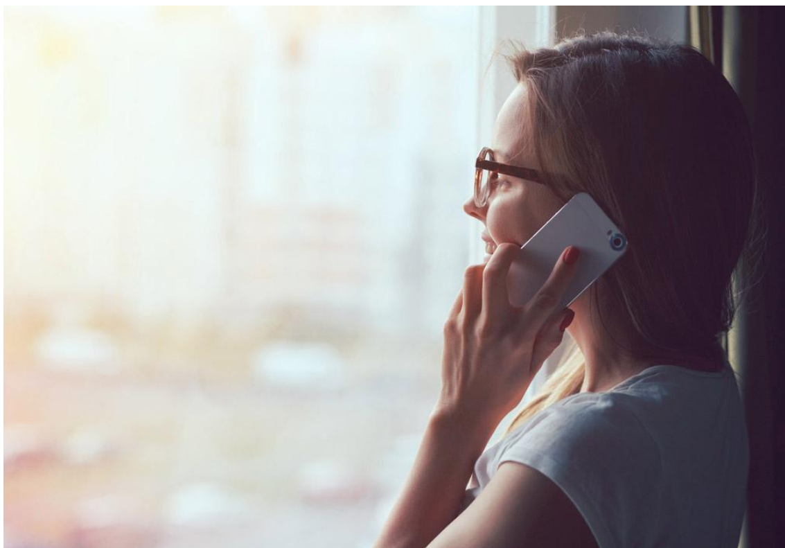
Laghdófar táillí fánaíochta an 30 Aibreán 2016