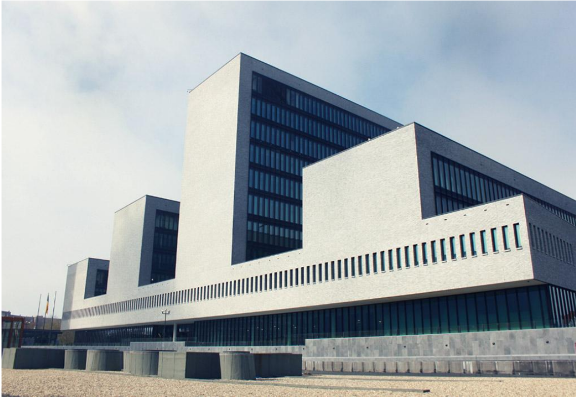
Az Europol központja Hágában, Hollandiában.