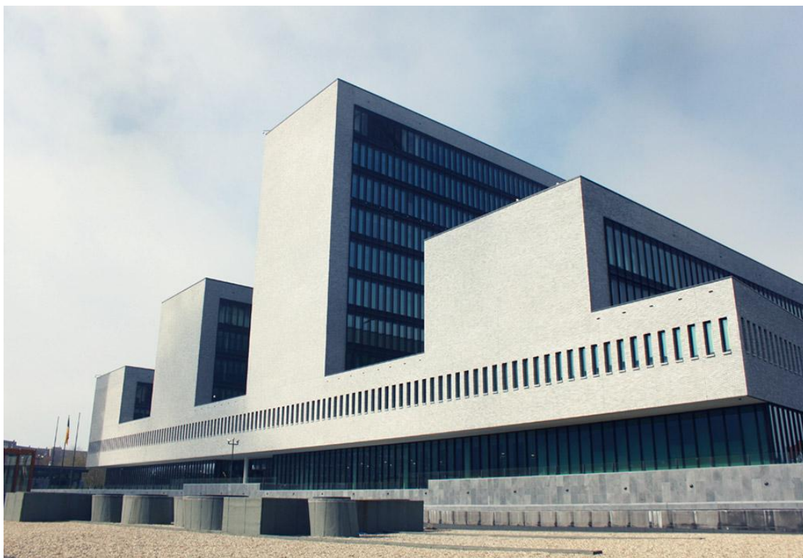
Centrála Europolu, Haag, Holandsko