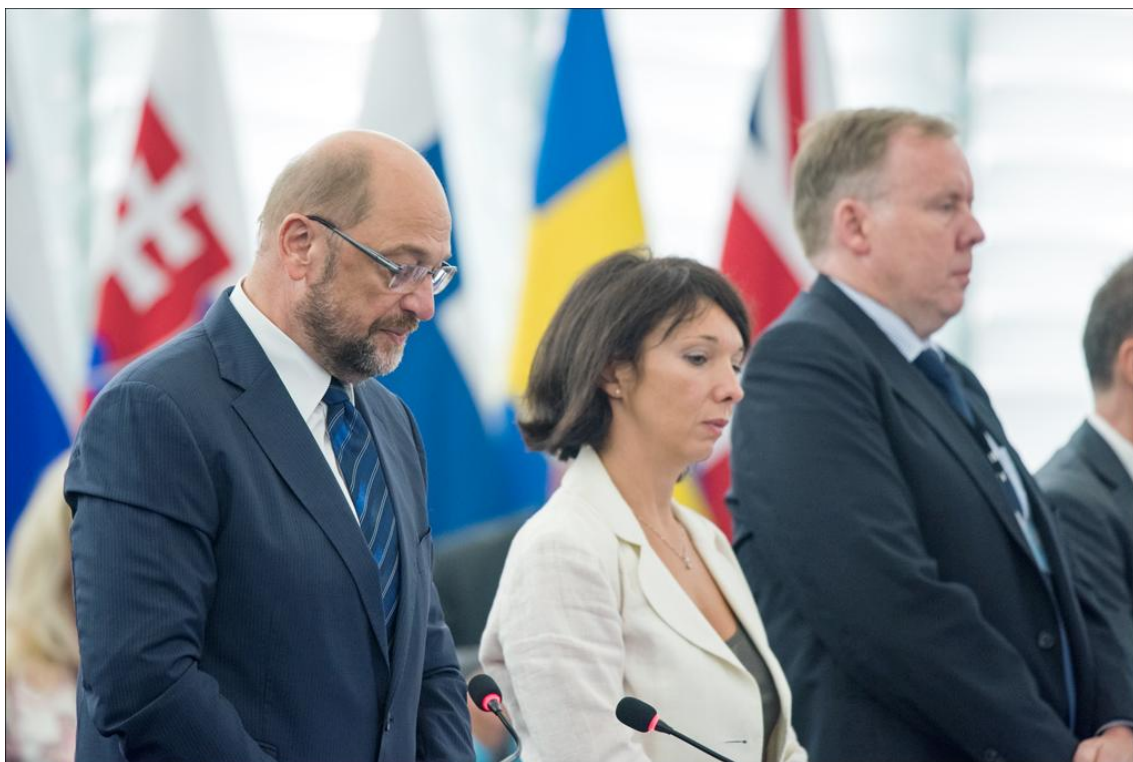
Il Parlamento europeo osserva un minuto di silenzio per le vittime del terremoto del 24 agosto nell'Italia centrale