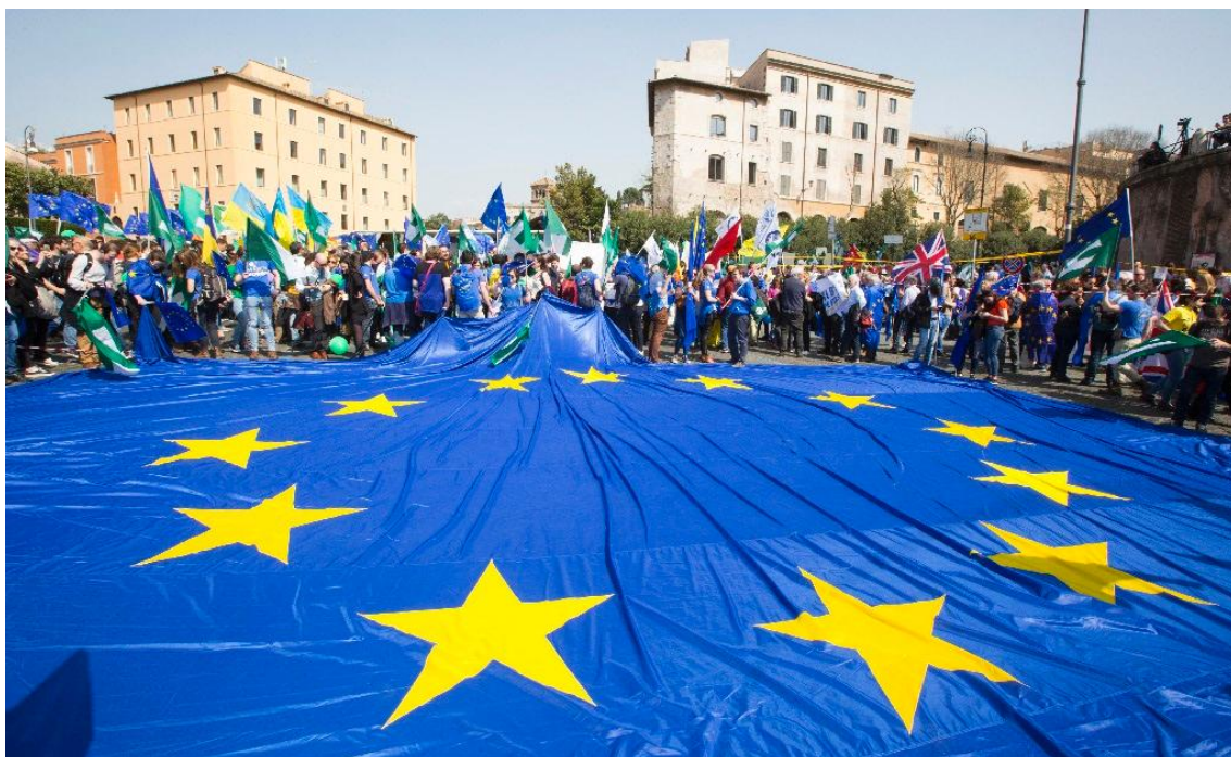
Takto to tento víkend vyzeralo v uliciach Ríma