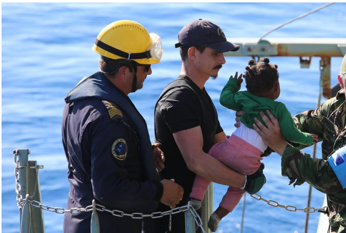
Un copil este salvat în cadrul unei operațiuni Frontex

Presiunea migratorie asupra Europei a arătat necesitatea reformei sistemului de azil UE și a unei distribuiri mai corecte a responsabilității între statele UE.