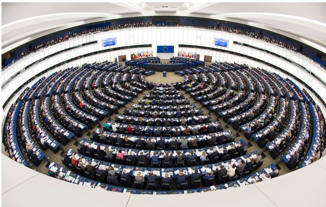
De samenstelling van het Parlement zal na de Brexit veranderen