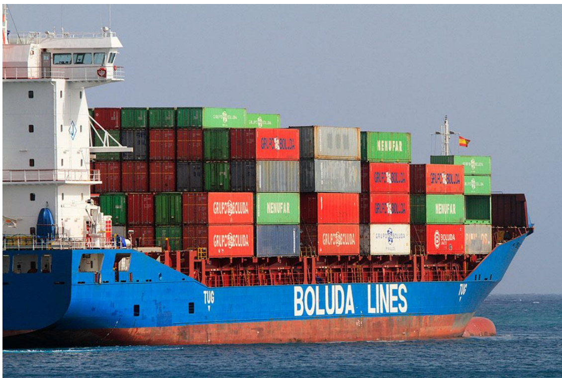
A ship with containers