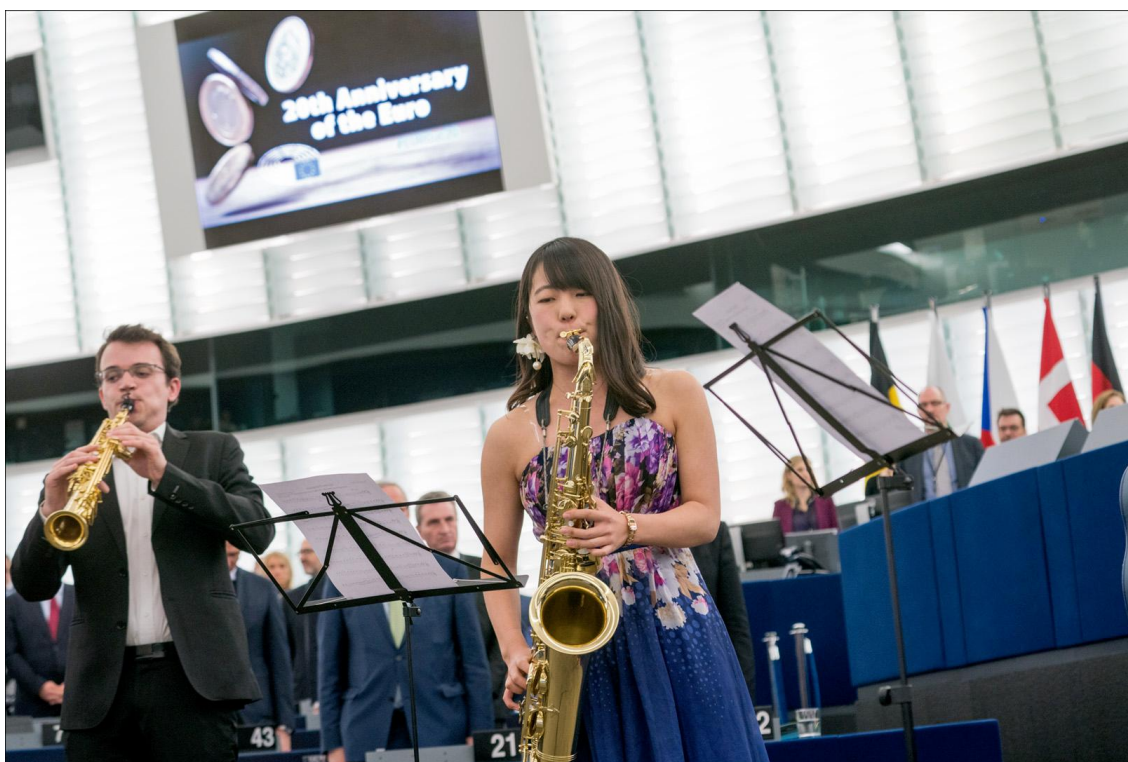
El cuarteto de saxofones Avena tocó el himno de Europa en la ceremonia del aniversario del euro.