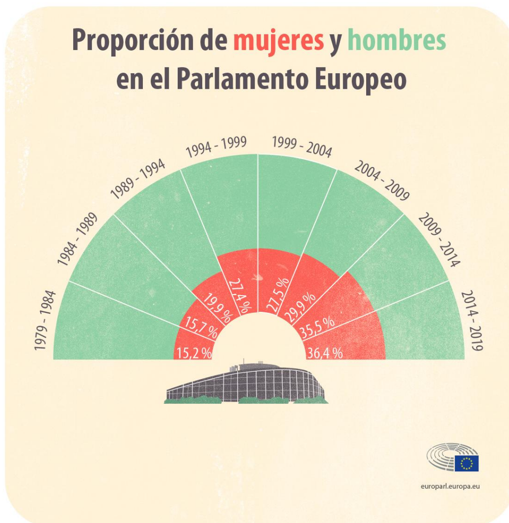
Proporción de mujeres y hombres en el Parlamento Europeo.

Las mujeres siguen estando subrepresentadas en la política, tanto a nivel europeo como a escala local y nacional. Así lo confirma un estudio del Parlamento Europeo .