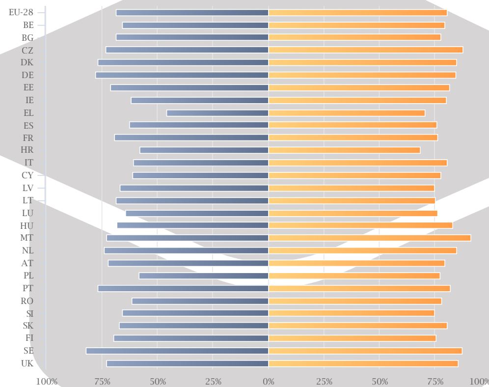
Leibhéal meánoideachais shinsearaigh agus iar-mheánscoile neamhthreasach oideachais (ISCED 3-4)