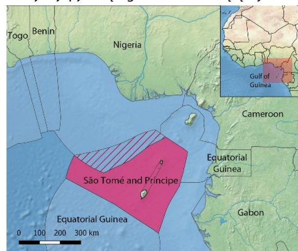
Wody Wyspy Świętego Tomasza i Książęcej

Strefa połowów określona w protokole wyklucza obszar eksploatowany wspólnie przez Nigerię i Demokratyczną Republikę Wysp Świętego Tomasza i Książęcej (krzyżowo).