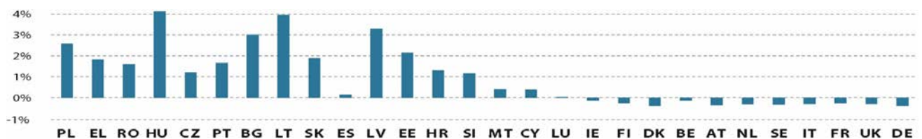
Gráfico 2. Saldos presupuestarios operativos (% de RNB, 2018)

En el gráfico 2 se clasifican todos los Estados miembros según la cifra absoluta de su saldo presupuestario operativo en 2017, al igual que antes, pero se muestran los saldos presupuestarios operativos en relación con la RNB. Al examinar el saldo presupuestario operativo relativo, no solo cambia la clasificación respecto al gráfico 1, sino que la magnitud de los saldos presupuestarios netos también se ve afectada : mientras que los fondos de la Unión, que los países beneficiarios netos reciben en términos netos, constituyen una parte sustancial de su RNB, estas cifras son mucho más reducidas para los contribuyentes netos en el contexto del saldo presupuestario operativo. Así pues, la perspectiva adoptada repercute en gran medida en la imagen global. Por ejemplo, desde un punto de vista contable, España recibe más financiación de la Unión que Letonia en términos absolutos, pero ocupa una posición más alta en la clasificación al tener en cuenta la magnitud relativa de contribuciones netas.