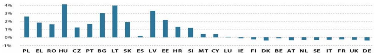
Figuur 2. Operationele begrotingssaldo's (% bni, 2018)

In figuur 2 zijn de lidstaten wederom gerangschikt op basis van hun absolute operationele begrotingsaldo's in 2017, maar zijn de saldo's afgezet tegen het bni. In vergelijking met de absolute operationele begrotingssaldo's van figuur 1 verandert bij deze relatieve operationele begrotingssaldo's niet alleen de rangorde, maar ook de hoogte van de nettobegrotingssaldo's : EU-middelen, die aan netto-ontvangers netto worden uitgekeerd, maken een aanzienlijk deel uit van het bni van deze ontvangende lidstaten, maar de cijfers liggen voor nettobetalers veel lager wanneer wordt gekeken naar de operationele begrotingssaldo's. Het aangenomen perspectief is dus sterk bepalend voor het totaalbeeld. Zo ontvangt Spanje vanuit boekhoudkundig oogpunt absoluut gezien meer EU-middelen dan Letland, maar staat de lidstaat hoger in de rangorde wanneer wordt gekeken naar de relatieve omvang van de nettobijdragen.