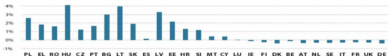
Figur 2. Operativt budgetsaldo (% BNI 2018)

I figur 2 rankas alla medlemsstater enligt det absoluta operativa budgetsaldot för 2017 som tidigare, men det visas i förhållande till BNI. Det är inte bara rankningen som ändras jämfört med figur 1 när man i stället beaktar det operativa budgetsaldot ur ett relativt perspektiv, utan även storleken på det operativa nettobudgetsaldot påverkas: medan EU-medel, som nettomottagarländer tar emot i nettovärde, utgör en betydande del av deras BNI, är dessa siffror mycket lägre för nettobetalare när det gäller det operativa budgetsaldot. Därför påverkar det tillämpade perspektivet den övergripande bilden väsentligt. Ur ett redovisningsperspektiv får t.ex. Spanien mer EU-medel än Lettland i absoluta siffror men "rankas" högre när man beaktar nettobidragets relativa storlek.