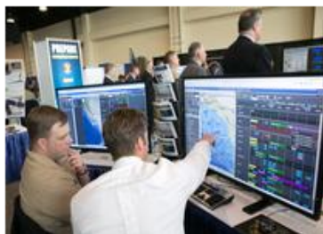
Parte dintr-un sistem C4I