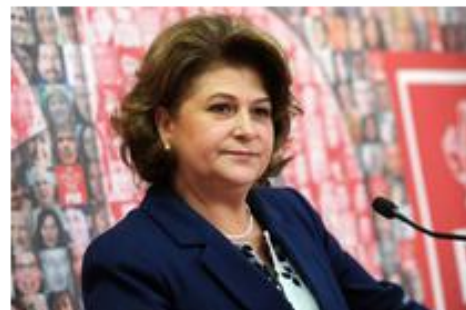
Rovana Plumb

Comisia juridica a Camerei Deputatilor a votat luni impotriva inceperii urmaririi penale a ministrului demisionar al Fondurilor Europene, Rovana Plumb, in dosarul Belina, anunta Agerpres. Rovana Plumb a fost prezenta alaturi de avocatul sau in sedinta Comisiei Juridice. La iesirea de la Comisia Juridica, Rovana Plumb a afirmat ca "Am parcurs dosarul, nu exista niciun argument care sa stea la baza unei astfel de acuzaatii."