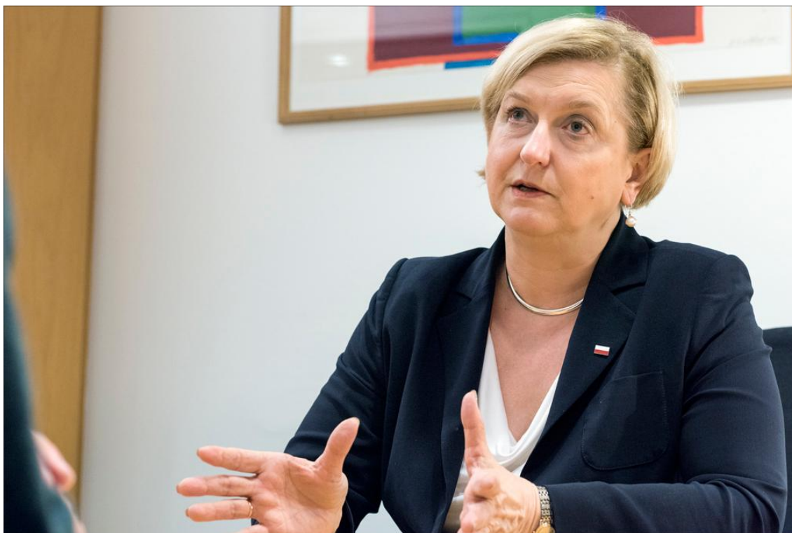
Interviu su Anna Elżbieta Fotyga

ES, jos narės ir piliečiai vis dažniau tampa Rusijos ir teroristinių organizacijų skleidžiamos dezinformacijos ir propagandos taikiniais.