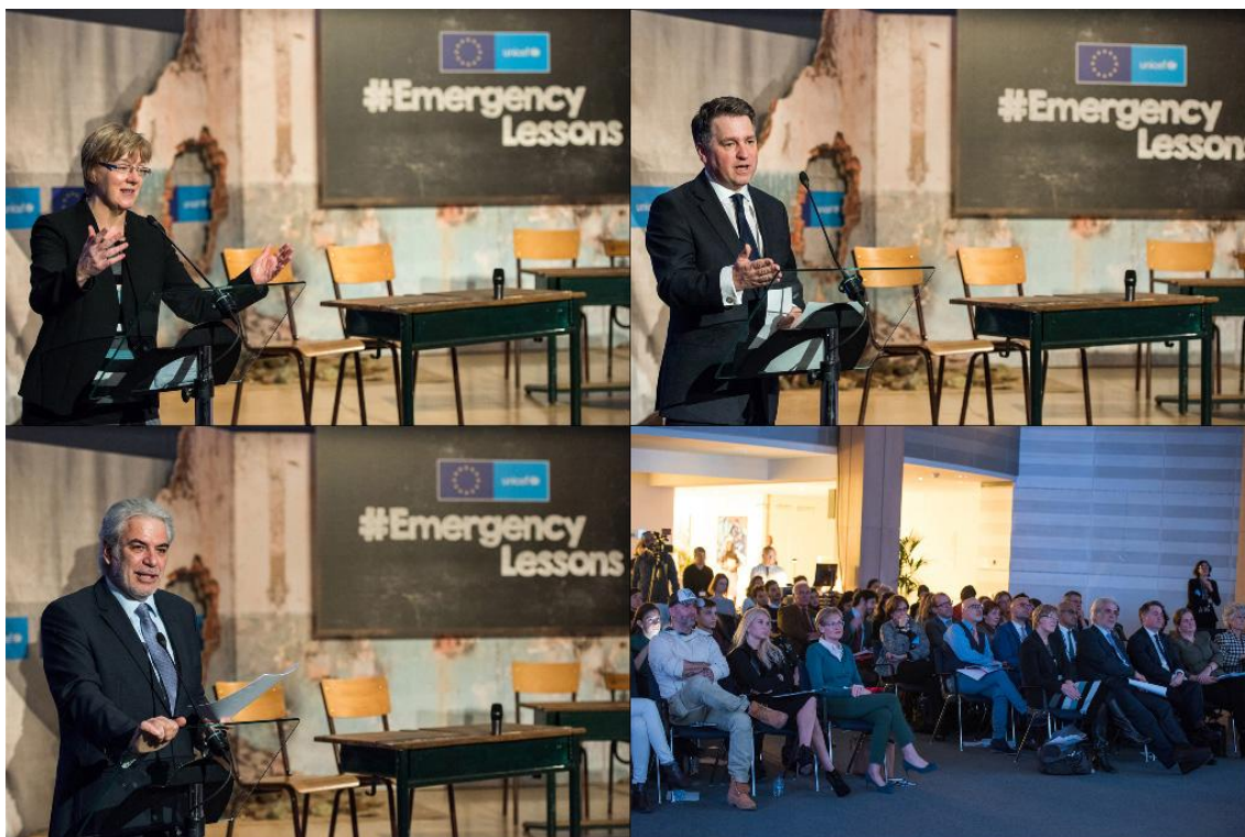
Председателката на комисията по развитие Линда Макавън (горе вляво), заместник-изпълнителният директор на УНИЦЕФ Джъстин Форсайт (горе вдясно) и еврокомисар Христос Стилианидис (долу вляво) по време на конференцията