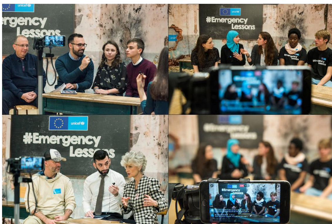
Деца бежанци, учители и посланици на УНИЦЕФ обясниха какво е значението на училището при избухването на кризи в интервюта за страницата на ЕП във Facebook.