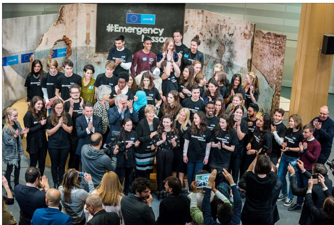
Групова снимка на участниците