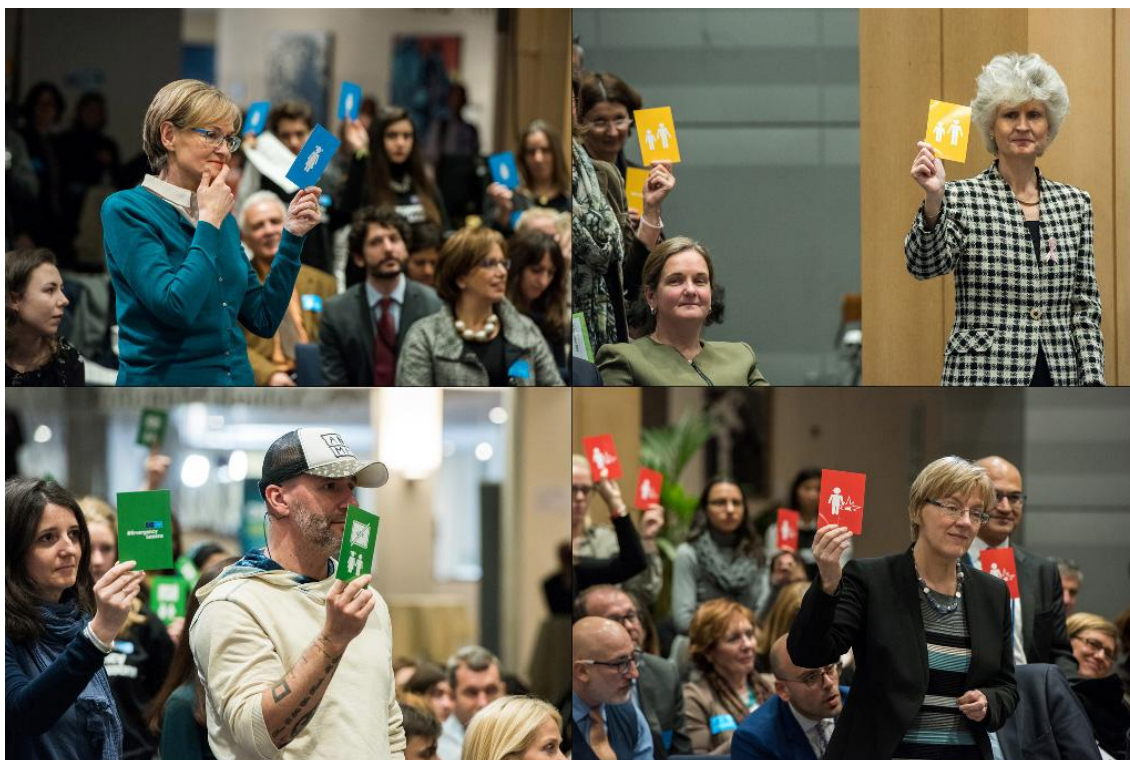
Tijdens het evenement verrasten de jeugdambassadeurs het publiek met een kaartspel