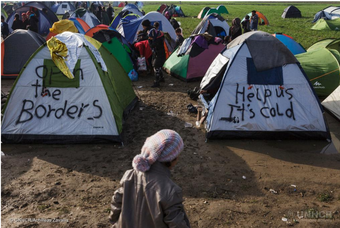
Parlament poziva zemlje članice da poštuju svoje obaveze i ubrzaju preseljenje azilanata iz Grčke i Italije