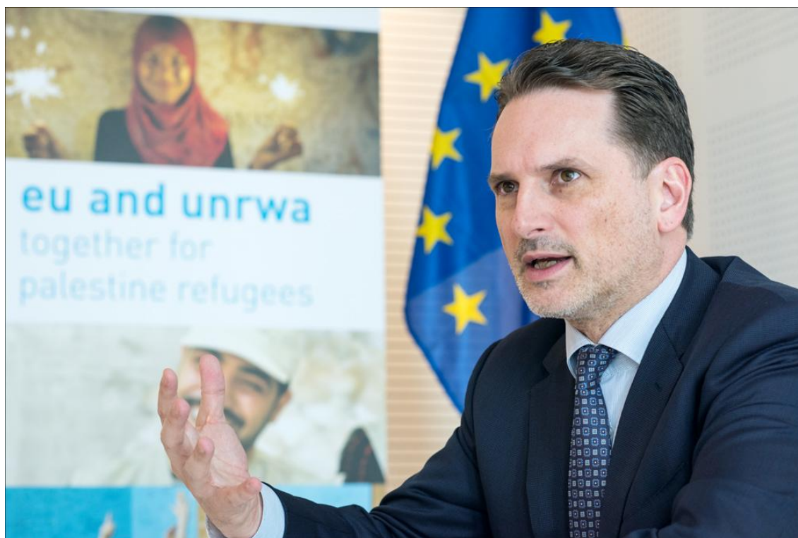
Pierre Krähenbühl, szef UNRWA