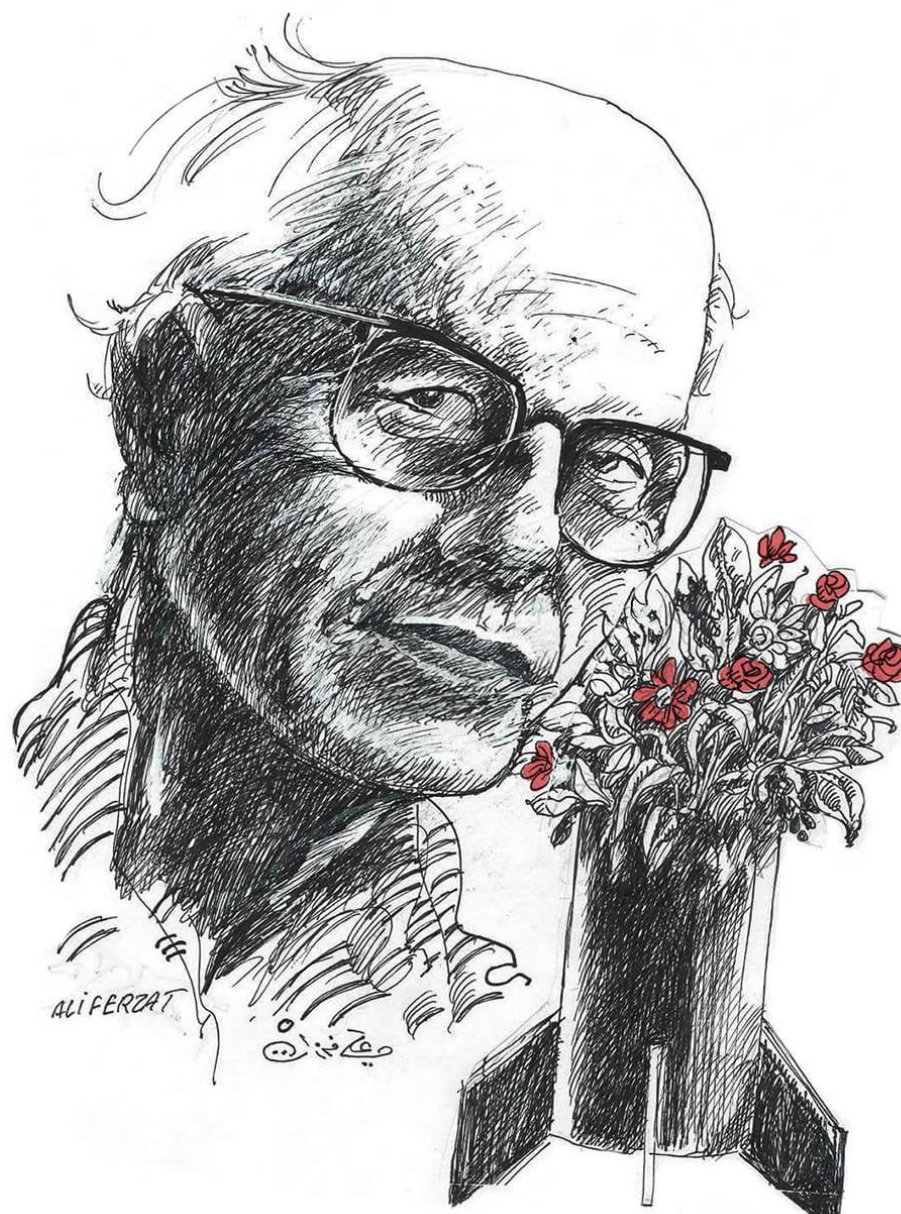
Inimõiguspreemia 2011. aastal pälvinud Ali Ferzati joonistus kujutab Andrei Sahharovi