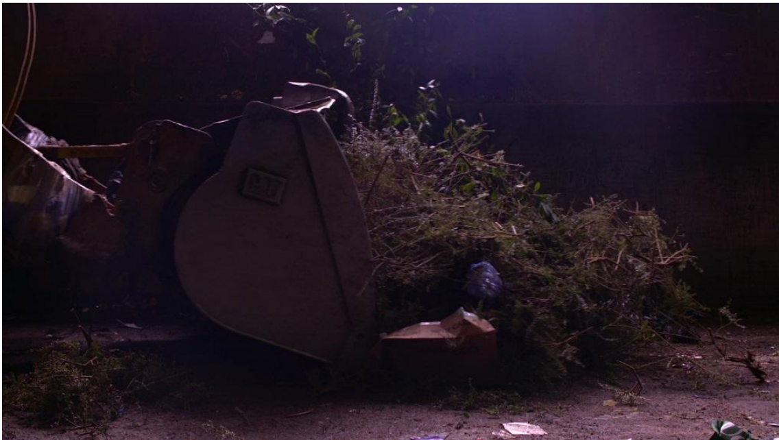
Den cirkulära ekonomin