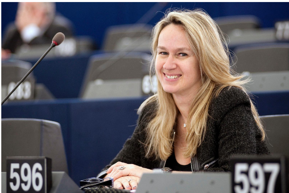
Constance Le Grip (néppárti, francia) jelentéstevő