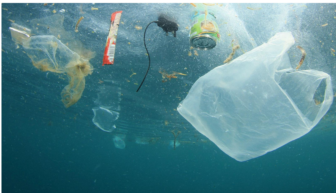
Plastikforurening i havet

Få nøgletallene og konsekvenserne af plastik i vores have i infografikken og læs, hvad EU gør for at begrænse mængden.