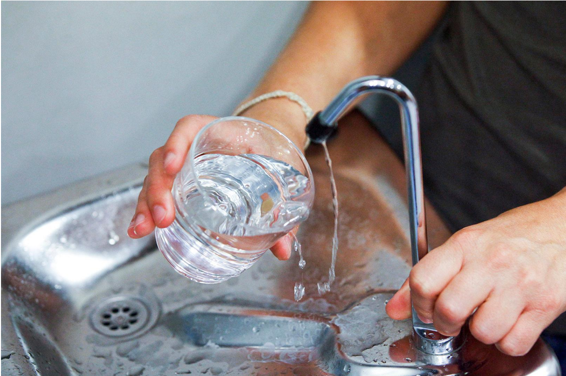
Πόσιμο νερό στην ΕΕ

..... " Για την τιμή ενός μπουκαλιού μεταλλικού νερού θα έχετε σχεδόν 700 λίτρα νερού βρύσης. "