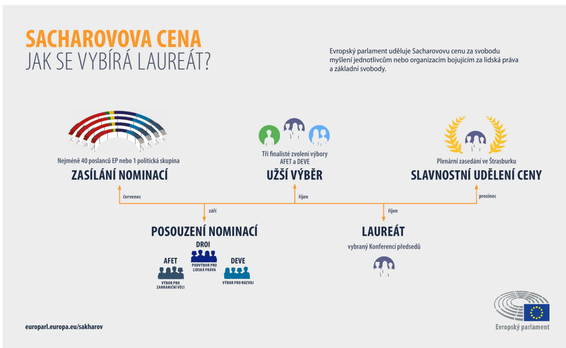
Postup výběru laureáta lidskoprávní Sacharovovy ceny