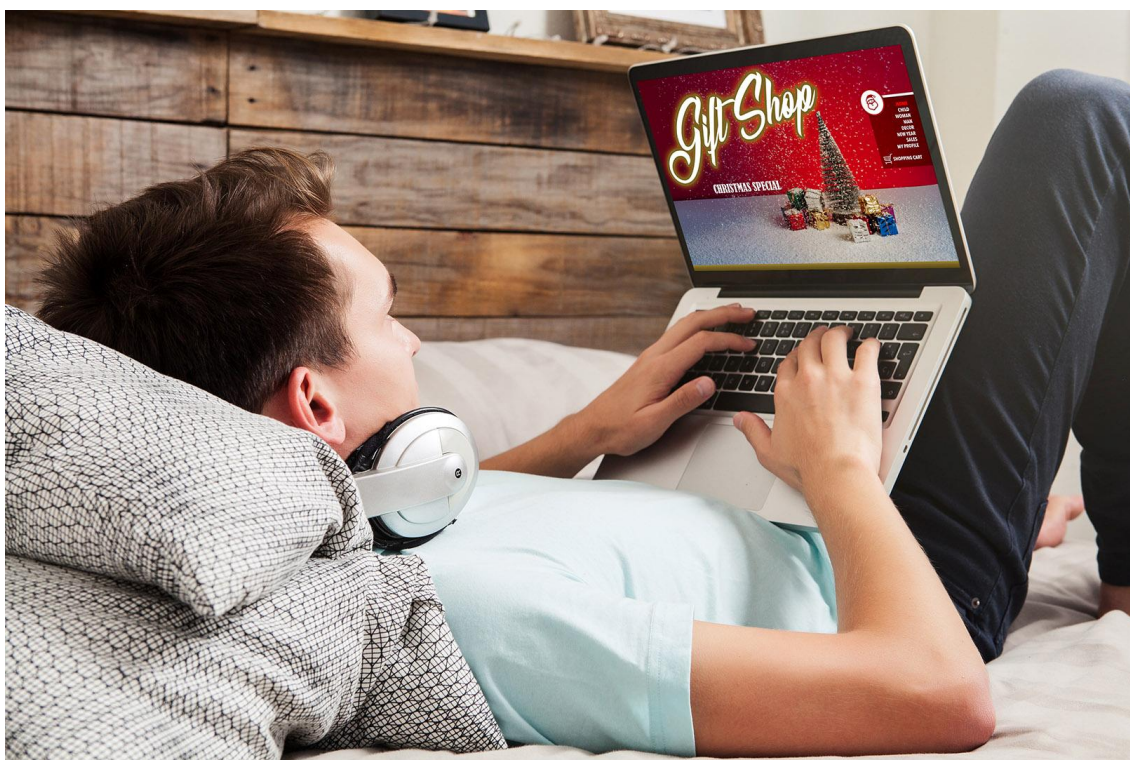
Los consumidores ya pueden comprar en internet sin bloqueo geográfico.