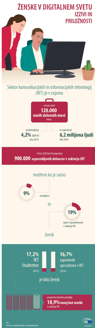
Ženske v digitalnem svetu