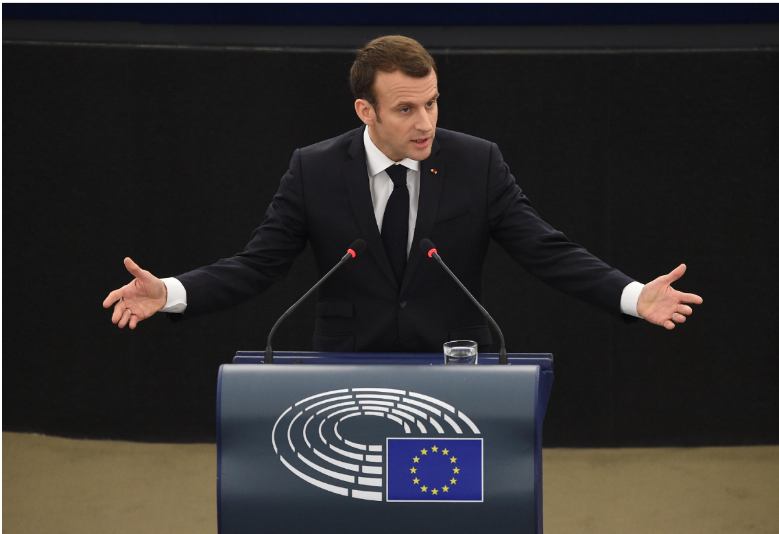
Ranskan presidentti Emmanuel Macron puhuu meille Euroopan parlamentin täysistunnossa Strasbourgissa