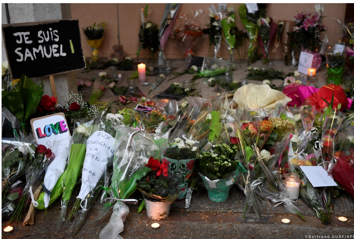
Flowers and a placard reading 'I am Samuel' are placed at the entrance of a middle school in Conflans-Sainte-Honorine.

Lai apkarotu terorismu, ir jārisina tādi jautājumi kā ārvalstu izcelsmes kaujinieku darbība, robežkontrolē un finansējuma plūsmu likvidēšana. Uzziniet vairāk par ES pretterorisma politiku.