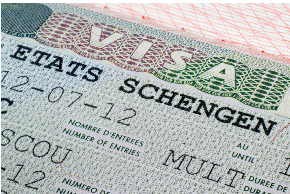
Az EP a schengeni rendszert stabilizáló javaslatáról szavazott