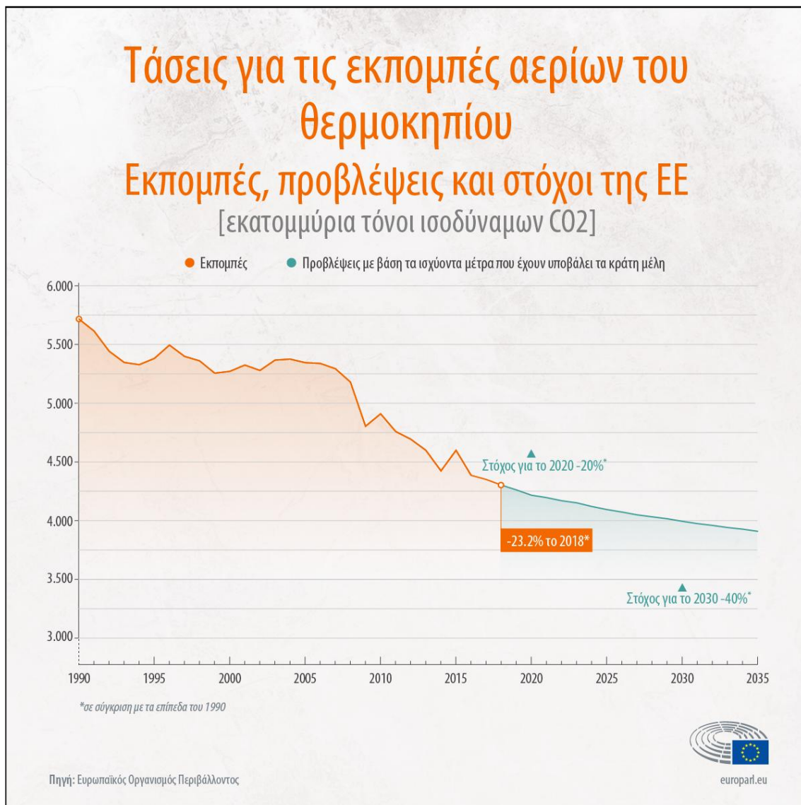
Τάσεις στις εκπομπές αερίων του θερμοκηπίου

Οι στόχοι της ΕΕ για το 2020 καθορίζονται στο πακέτο μέτρων για το κλίμα και την ενέργεια που εγκρίθηκε το 2008. Ένας από τους στόχους είναι η μείωση των εκπομπών αερίων του θερμοκηπίου κατά 20% σε σύγκριση με τα επίπεδα του 1990.